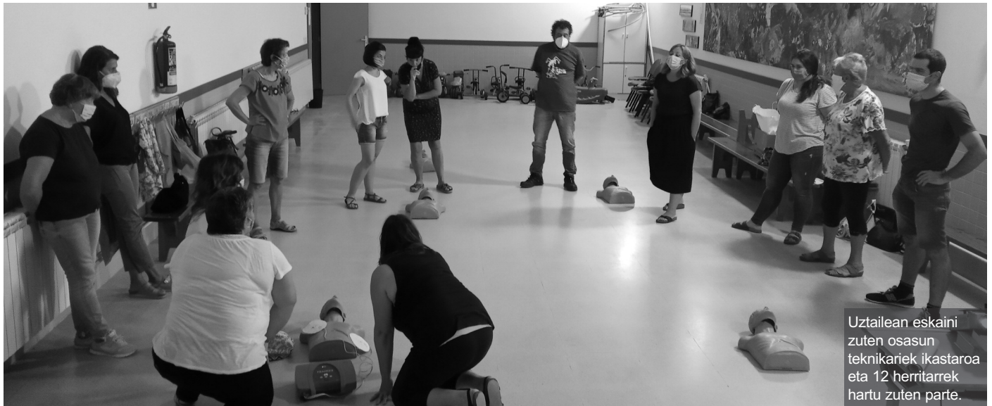
Uztailean eskaini zuten osasun teknikariek ikastaroa eta 12 herritarrek hartu zuten parte.

tzeko, ikastaro bat eskaini zuten Udaleko osasun teknikariek Igeldon, eta argi utzi zuten mezu bat: «Bizitza bat salbatzea denon esku dago. Hori barneratu behar dugu denok eta aktibo izan behar dugu horrelako egoeren aurrean. Ez da sanitariooi dagokigun gauza bat bakarrik».