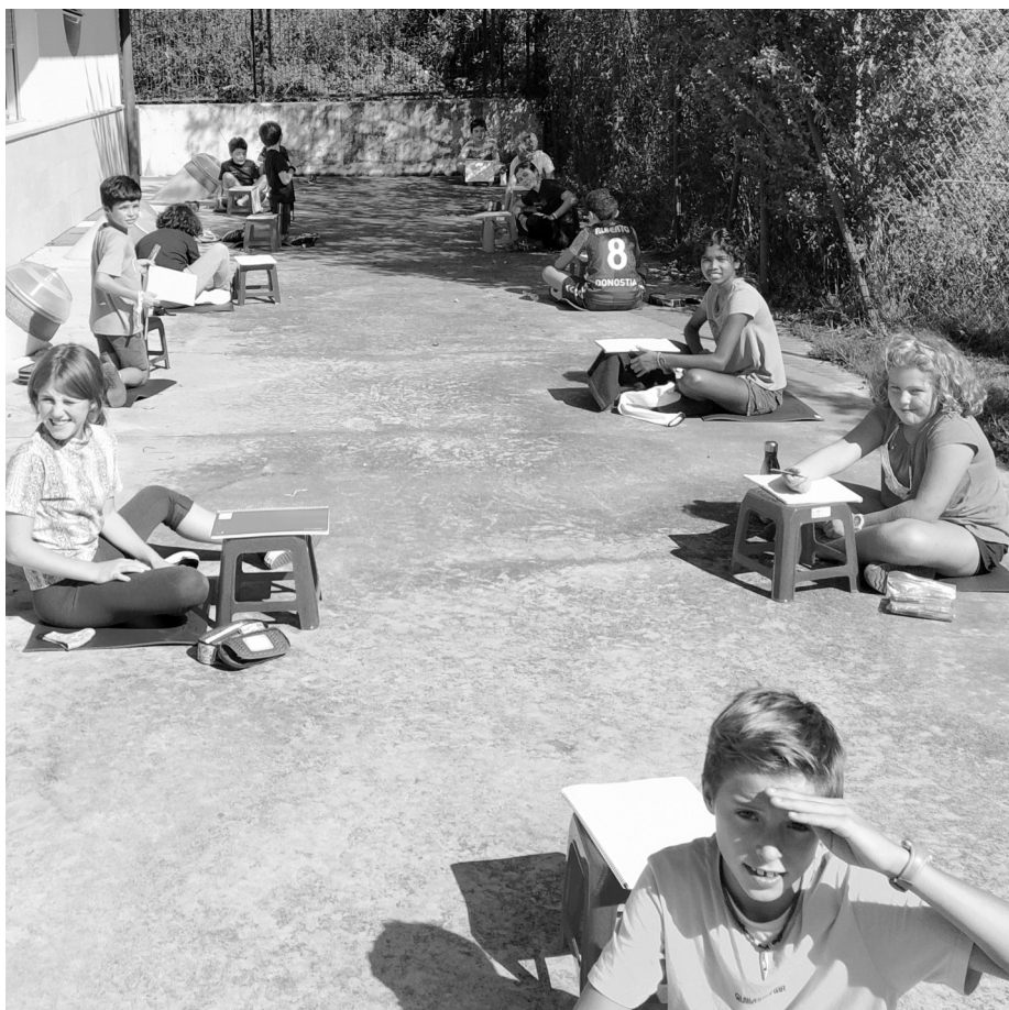
Distantziak mantenduz, Lehen Hezkuntzako taldeek maskararik gabe egoteko aukera dute terrazan.

Aurtengo ikasturtean guztira 66 ikasle ditugu eskolan: 2 eta 3 urteko taldean 13, 4 eta 5 urteko-