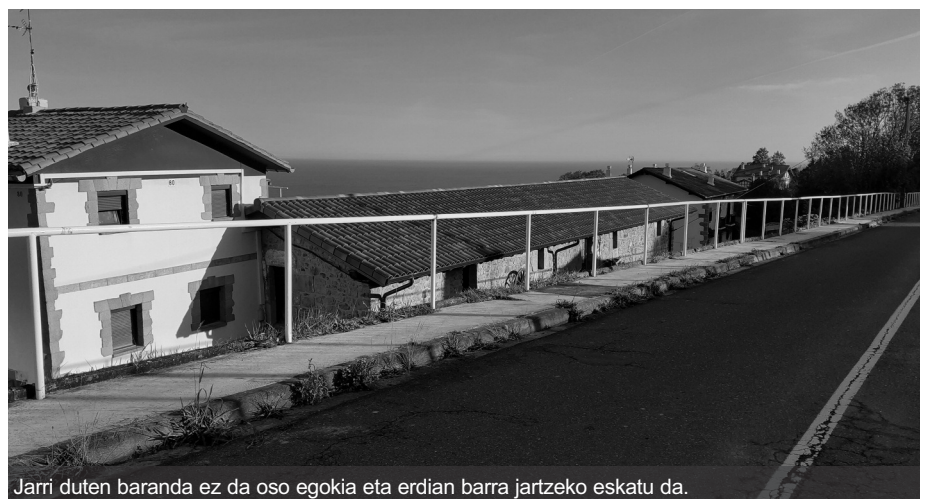
Jarri duten baranda ez da oso egokia eta erdian barra jartzeko eskatu da.

Alde batetik, Pilotegi bidean arriskuak geratu diren puntu batzuk hobetzeko eskatu du eta dauden zabalgunek txukundu eta egokitzeke. Egindako obrari ahalik eta etekin gehien ateratzea da helburua eta