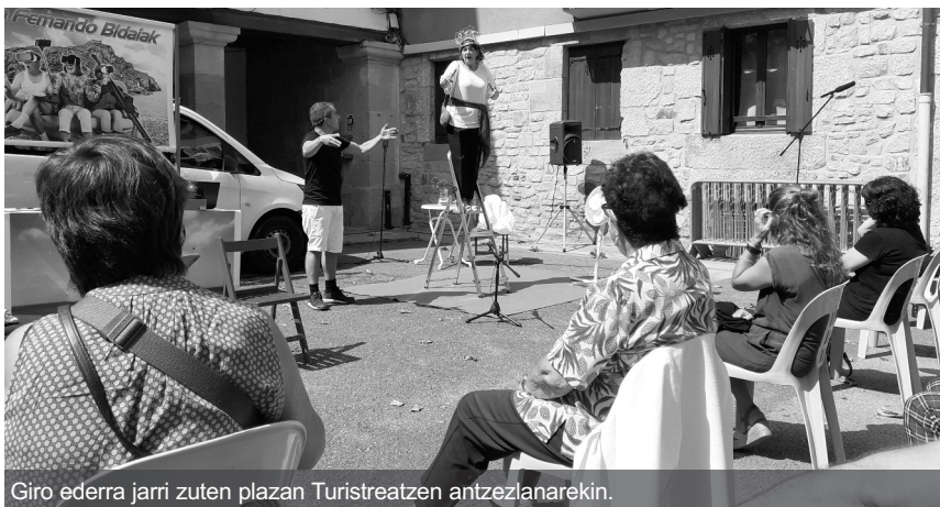
Giro ederra jarri zuten plazan Turistreatzen antzezlanarekin.

Horretaz gain, ikasturte berriarekin Herri Kontseiluak ere hausnarketarako tartea hartu du eta Herri Batzarra egiteko asmoa du abenduan, eskuartean dituen gaien inguruan hitz egiteko. Batez ere, Toki Entitate Txikiaren gaia lantzeko. Hori guztia aurkituko duzu datozen orrietan.