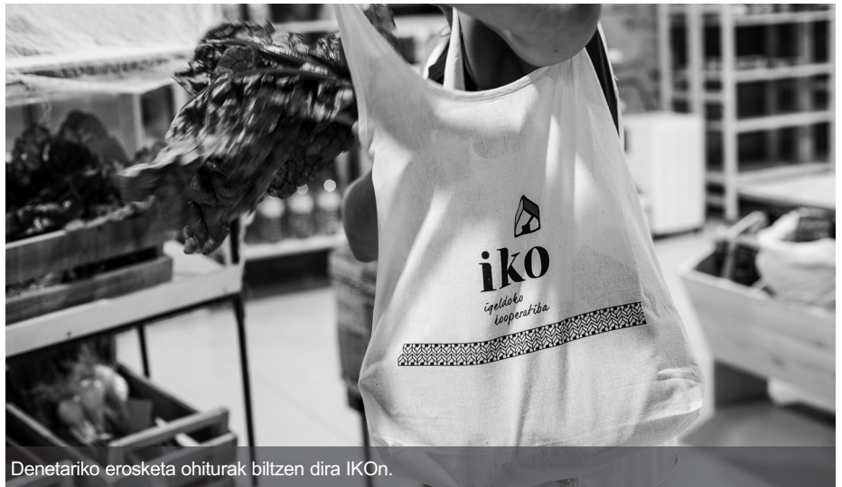
Denetariko erosketa ohiturak biltzen dira IKOn.

Proiektua herrian eta herritik kanpo zabaltzeko ere, lan handia egin dute. Bazkideen artean eta