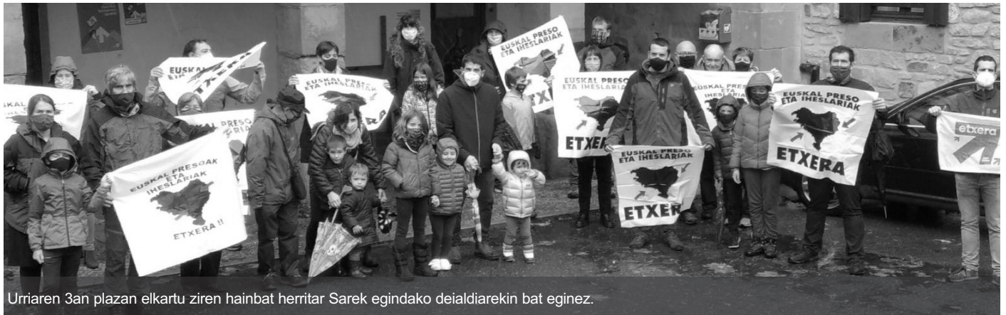
Urriaren 3an plazan elkartu ziren hainbat herritar Sarek egindako deialdiarekin bat eginez.

Bestalde, Jubilatuek ere memoria historikoaren inguruan lanketa egiteko asmoa dute eta denen arteko elkarlana aberasgarria izango dela argi dute denek.