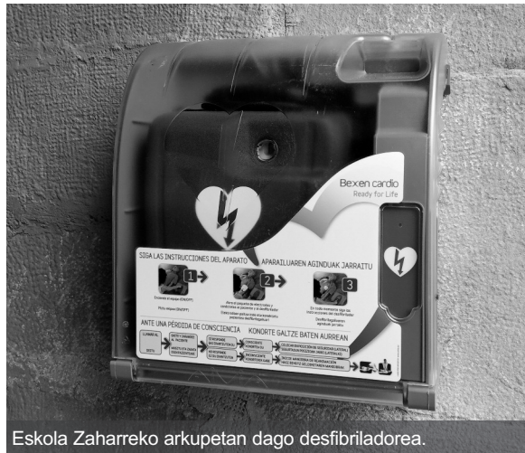
Eskola Zaharreko arkupetan dago desfibriladorea.

Udaleko osasun teknikariek Herri Kontseiluko kideei azaldutakoaren arabera, lehenengo gauza 112ra deitzea da. Eta ambulanzia iritsi bitartean erabili beharko litzateke desfibriladorea. Nahiz eta askori apurua eman, bihotzekoen kasuan, ezer ez egitea baino eraginkorragoa dela zerbait egitea azpimarratu