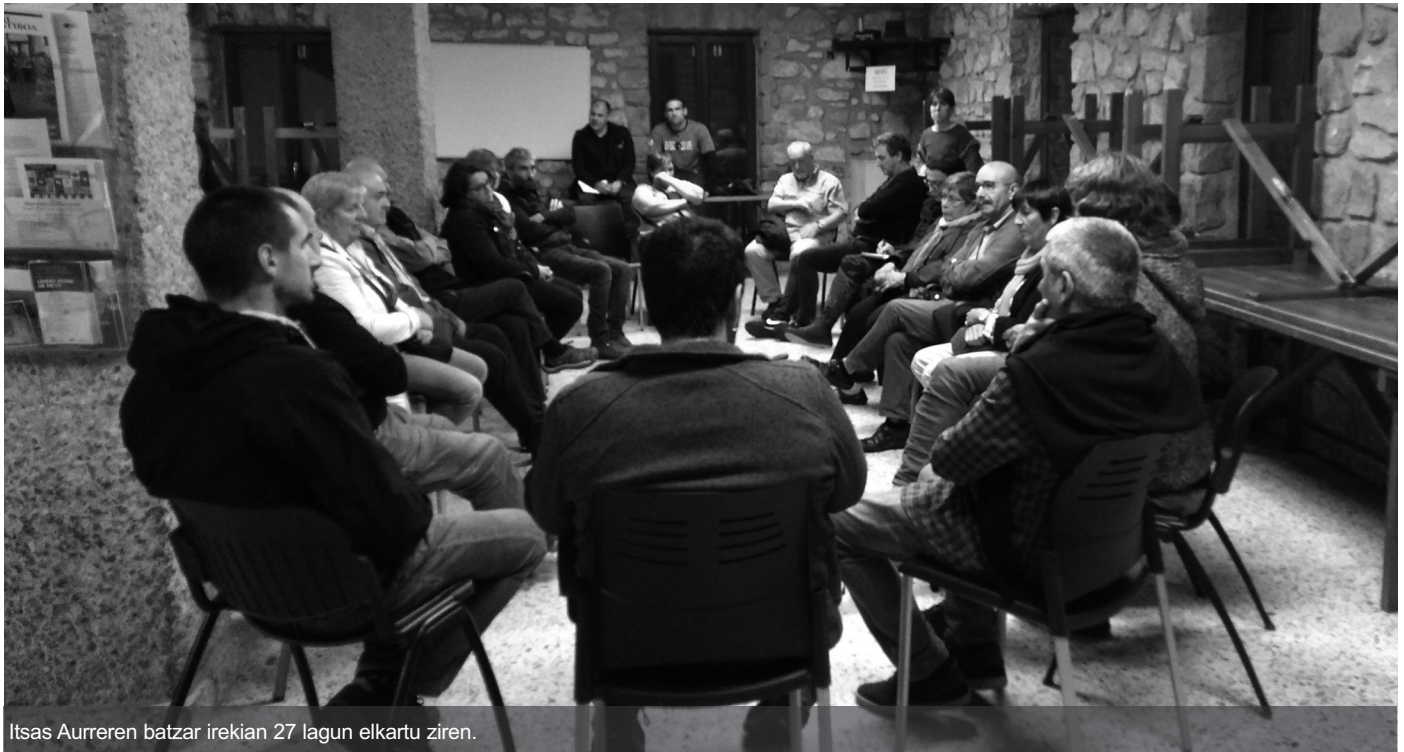
Itsas Aurreren batzar irekian 27 lagun elkartu ziren.