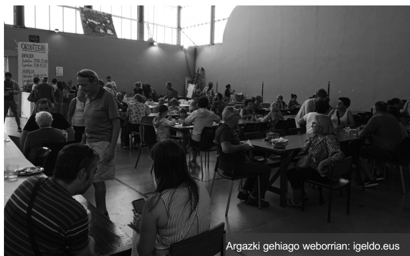
Argazki gehiago weborrian: igeldo.eus

«Kooperatibak herritarrentzat onurak ekarriko dituelakoan, azken pausua zehaztu, eta aurrera!», adierazi dute.