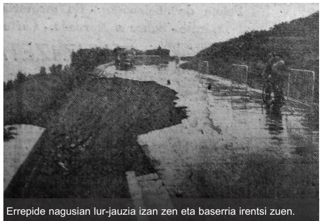
Errepide nagusian lur-jauzia izan zen eta baserria irentsi zuen.