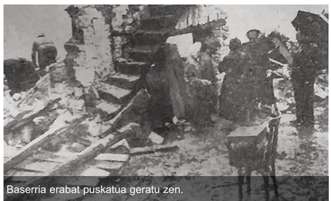
Baserria erabat puskatua geratu zen.

A tal honetan, herriko argazki zaharrak plazaratu nahi ditugu. Herriko historia eta istorioak kontatuz, zer hitz egina eta pentsatua emanaz. Gure asmoa herriarekin lotura duten mota ezberdinetako argazkiak jartzea da, eta bide batez, zure etxeko bazterrak astintzea ere eskatu nahi dizugu, interesgarriak izan daitezkeen argazki zaharrak dituzun begiratu eta gurekin konpartitzeko. Guztion artean lan polita egin baitezakegu. Animatu!