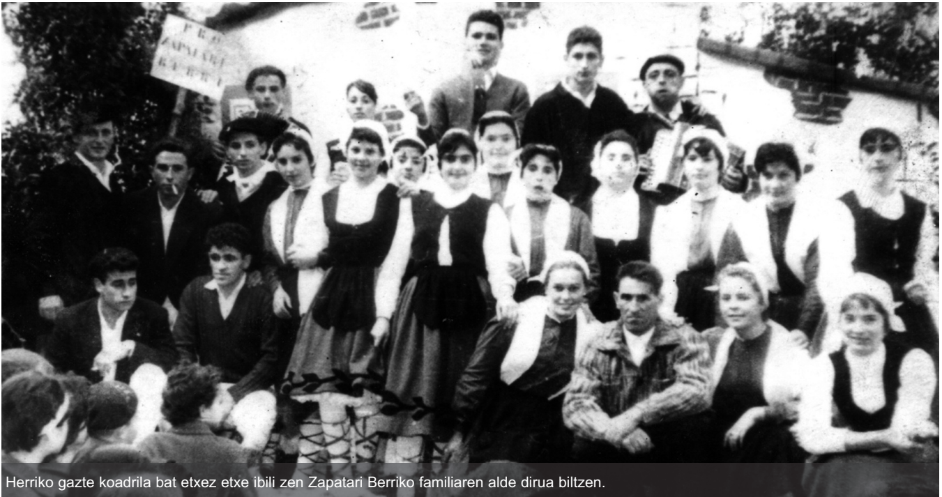
Herriko gazte koadrila bat etxez etxe ibili zen Zapatari Berriko familiaren alde dirua biltzen.