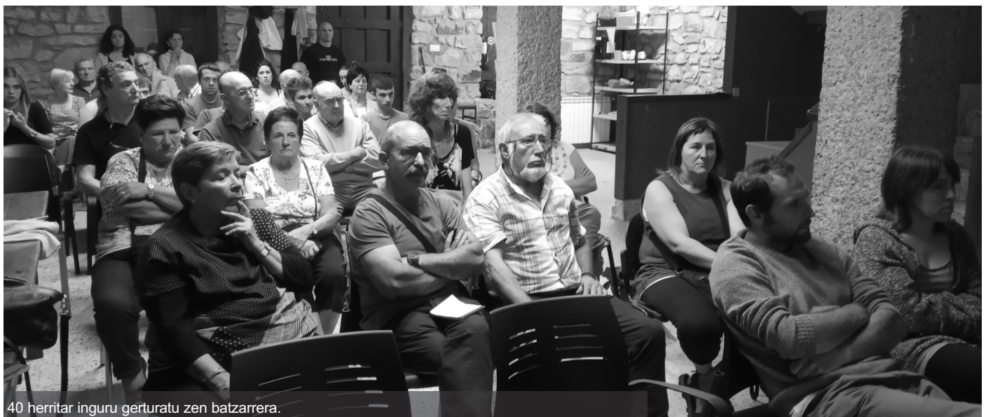
40 herritar inguru gerturatu zen batzarrera.

Balantze ekonomikoa orain egiteak ez zuela zentzurik azaldu zuten, urtea oraindik bukatzeke baitago, eta 2020ko lehenengo batzarrean egingo dela gaineratu zuten.