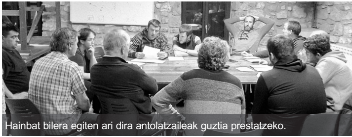
Hainbat bilera egiten ari dira antolatzaileak guztia prestatzeko.