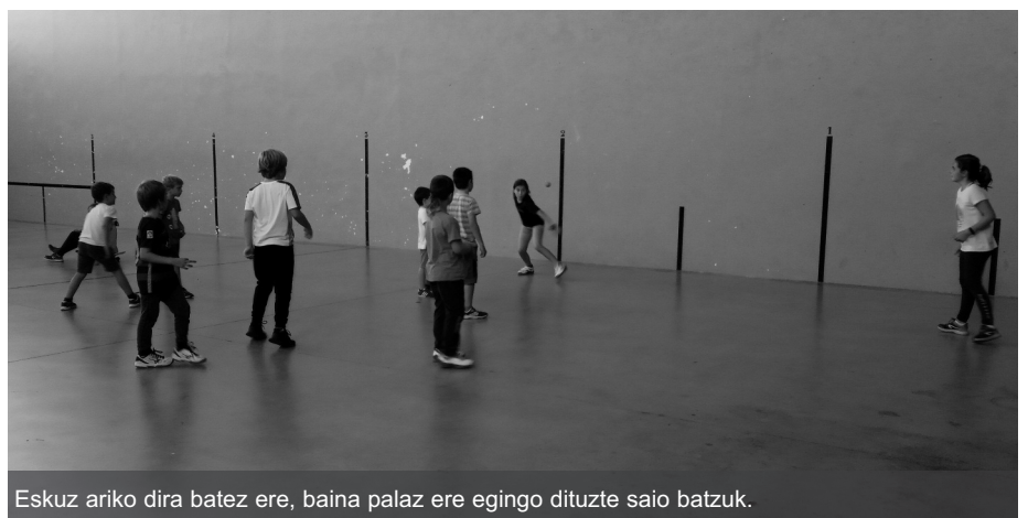
Eskuz ariko dira batez ere, baina palaz ere egingo dituzte saio batzuk.

elkarteko kideek: «Umeak pelotara gerturatzea eta pelotan jolas-tuz, ondo pasatzea». Horrez gain, iaz bezala, hainbat txapelketatan parte hartuko dutela azaldu dute. Lehenengo, alebinek jokatu dute eskuz, eta ondoren benjaminen txanda izango da. Eskolartekoak jokatzen dituzte. Eskuz aritu ostean, palaz ariko dira bai alebinak, baita benjaminak ere, Gipuzkoa mailako eskolartekoan.