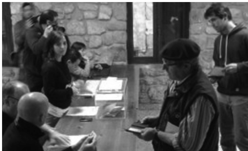
AZAROAK 10- Herri galdeketa: 'Igeldo udalerrria izatea nahi duzu?' %72,1ak hartu zuen parte eta horietatik %61,4ak baiezkoa bozkatu zuen.