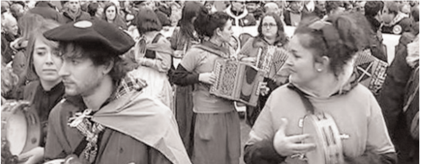
ABENDUAK 21 - ManiFESTAZioa egin zen Donostian, erabakitze eskubidearen alde. Donostiako Udaleko oposizio alderdiek errekurtsioa jarriko zutela iragarria zuten Diputazioaren Foru Dekretua bertan behera uzteko eskatuz, Igeldoren udalerrri izaera bertan behera utziz. Horren aurrean, igeldoar, donostiar eta gipuzkoar ugari atera zen kalera herritarren borondatea errespetatu zedin eskatzera.