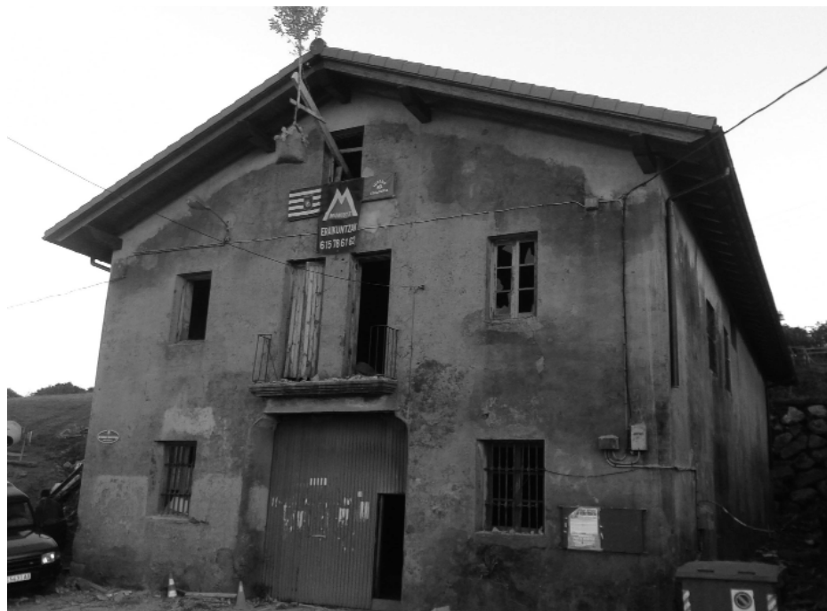
Sindikatura, teilatuta berriarekin.

2011ko azaroaren 27an, Batzar Nagusia egin zuten bazkideek eta Kooperatiba berri martxan jarri behar zela erabaki zuten. Horretarako, eraikina konpondu behar