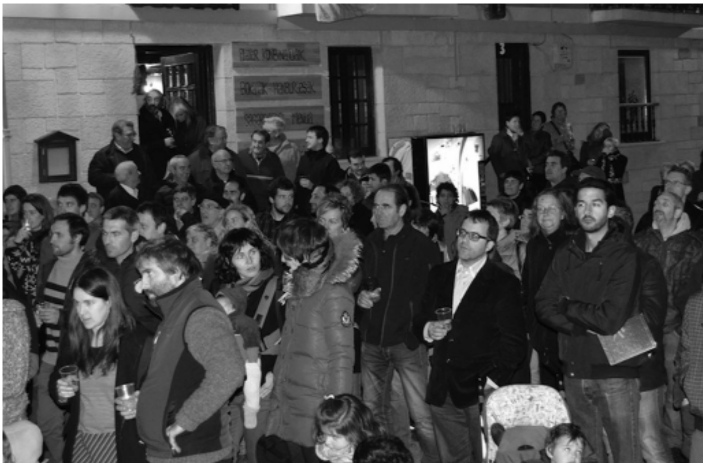
ABENDUAK 17 - Plazan herritar ugari elkartu zen Igeldo udalerrri izendatzeko erabakia ospatzera. Topa ere egin zuten denek batera.