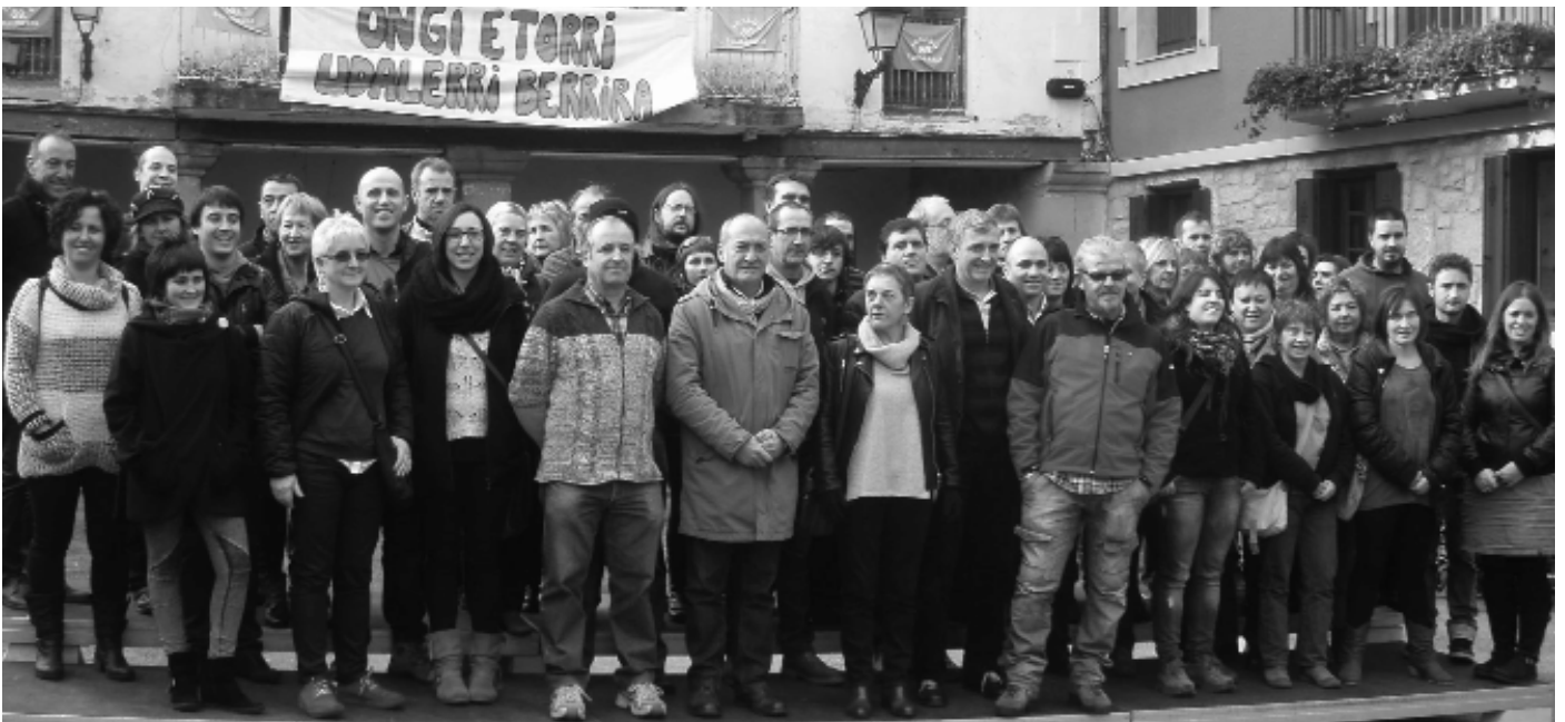
ABENDUAK 22 - Gipuzkoako Aldun Nagusia eta Gipuzkoako udalerrri ugaritako alkate eta zinegotziak Igeldon izan ziren. Ongi-etorria eman zioten udalerrri berriari.