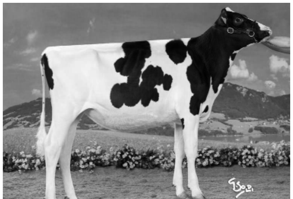
Lehiaketa ostean ateratako argazki ofiziala.