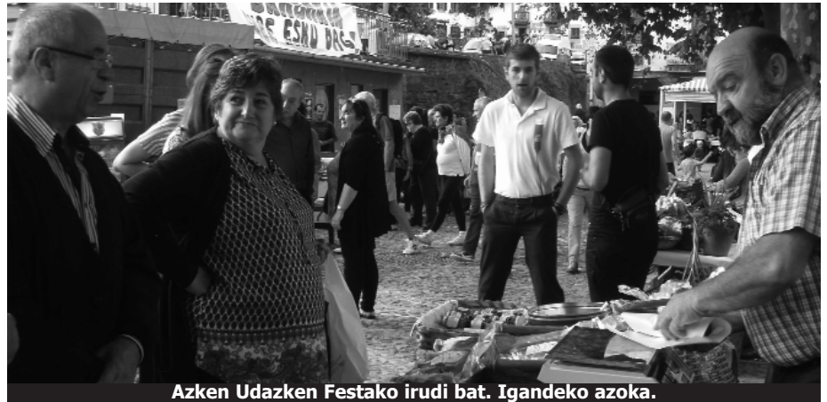
Azken Udazken Festako irudi bat. Igandeko azoka.

Udazken Festan herriko zaharrenei omenaldia egin izan zaie orain arte. Hemendik aurrera, ordea, ez dira aitona-amona zaharrenak omenduko, baizik eta urte horretan 80 urte betetzen dituztenak, hau da, generazio bat. Hala ere, aurtengoa desberdina izango da. Aurreneko urtea denez, aurten 80 urte bete dituztenei eta gorako guztiei emango zaie oparia. Bestela batzuk opari gabe gertuko lirateke.