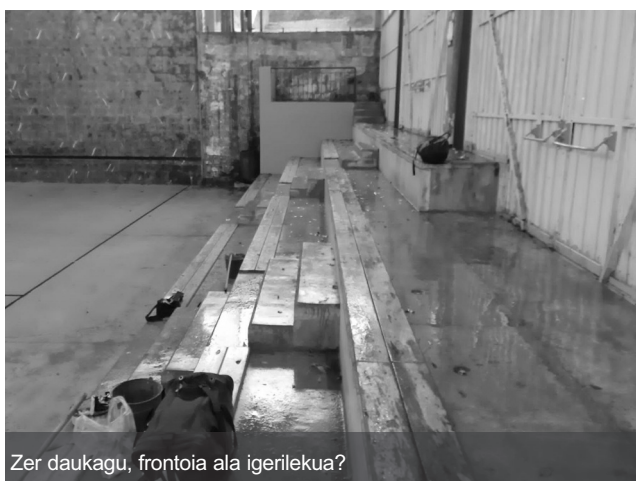
Zer daukagu, frontoia ala igerilekua?

laguntza eskatzeko aprobetxatu nahi du Orri Informatibo hau. Azaldu duteenez, nahikoa da argazki bat atera eta hitz gubxitan egoeraren berri ematea. Ondoren, helarazi. Aukera desberdinak daude: herrikontseilua@igeldo.eus/ Itsas Aurreko buzoian utzi/ Herri Kontseiluko kideren bati edo herriko dinamizatzaileari eman.