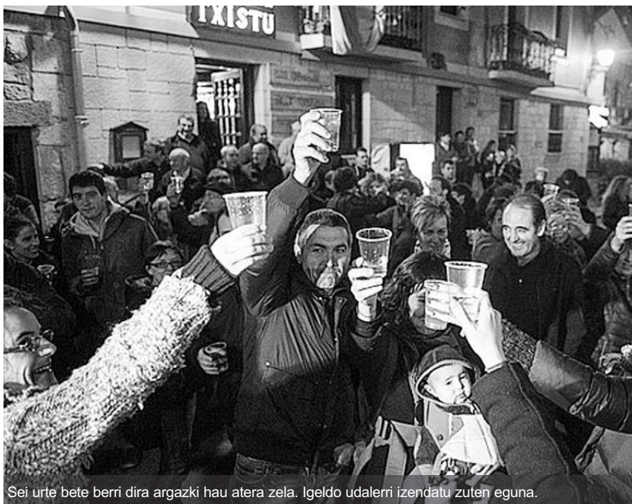
Sei urte bete berri dira argazki hau atera zela. Igeldo udalerriz izendatu zuten eguna.

Beraiek argi dute: «Bi aukera dauzkagu. Horrela jarraitu, Donostiako auzo abandonatu moduan, ezer ez daukagula. Edo tarteko bidea jorratu; hau da, Toki Entitate Txikia edo Auzo Udala delakoa». Azken hori, egungo egoeran, aurrerapauso nabarmena litzatekeela nabarmendu dute. Igeldotarren nahia eta erabakia