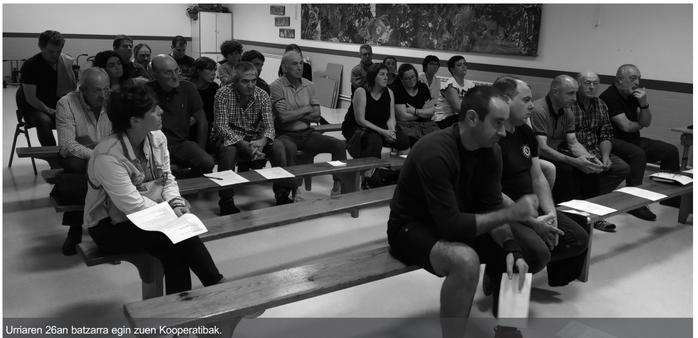
Urriaren 26an batzarra egin zuen Kooperatibak.

Iaz bezala, aurten ere bertako produktuez hornitutako saski ikusgarri bat zozketatuko du Kooperatibak. Eta zorte ona opa die denei: «Iaz boleto sariduna Sorondotarrek saldu zuten, ea aurten zein den sariduna. Zorte on guztioi!».