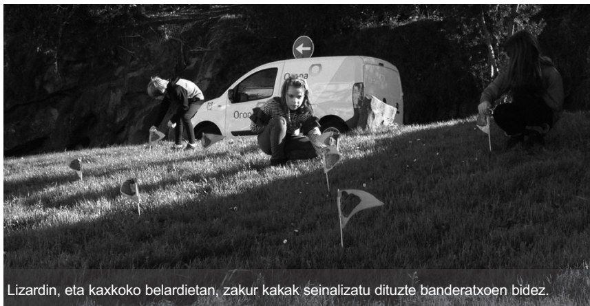
Lizardin, eta kaxkoko belardietan, zakur kakak seinalizatu dituzte banderatzxoen bidez.