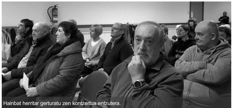
Hainbat herritar gerturatu zen kontzertua entzutera.

Lezkarrikoek emanaldiaren balorazioa egin dute: «Ikustera gerturatu ziren herritarrak pozik azaldu ziren kontzertua bukatu ondoren, nahiz eta gutxi izan hauek. Publikoaren gehiengoa, kantatzen genuenokin osatua