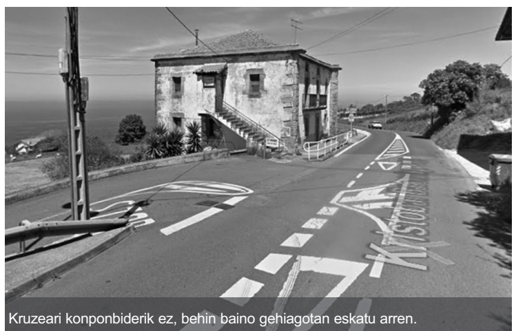
Kruzeari konponbiderik ez, behin baino gehiagotan eskatu arren.