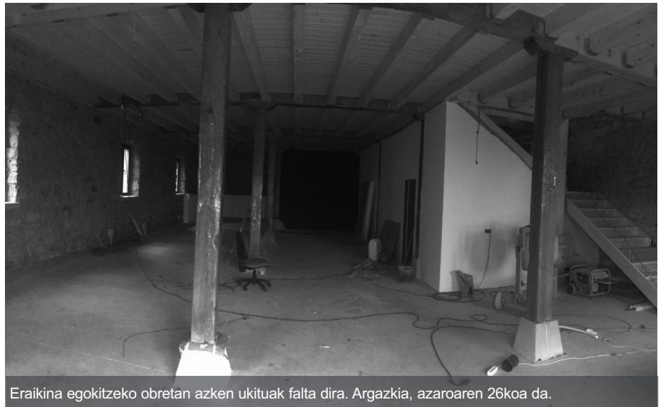
Eraikina egokitzeko obretan azken ikutuak falta dira. Argazkia, azaroaren 26koa da.

«110 bazkide inguruk osatzen dugu egun Kooperatiba, benetan adierazgarria eta indartsua», azal-