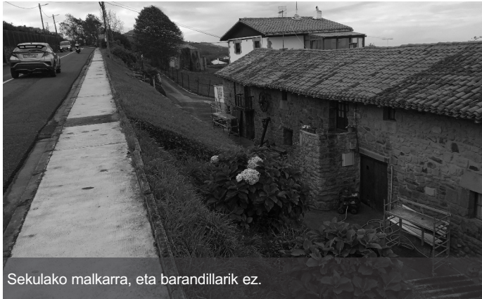
Sekulako malkarra, eta barandillarik ez.