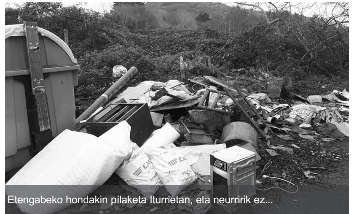
Etengabeko hondakin pilaketa Iturrietan, eta neuririk ez...