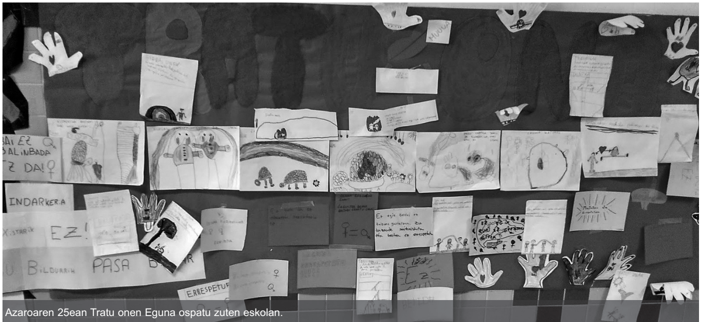
Azaroaren 25ean Tratu onen Eguna ospatu zuten eskolan.