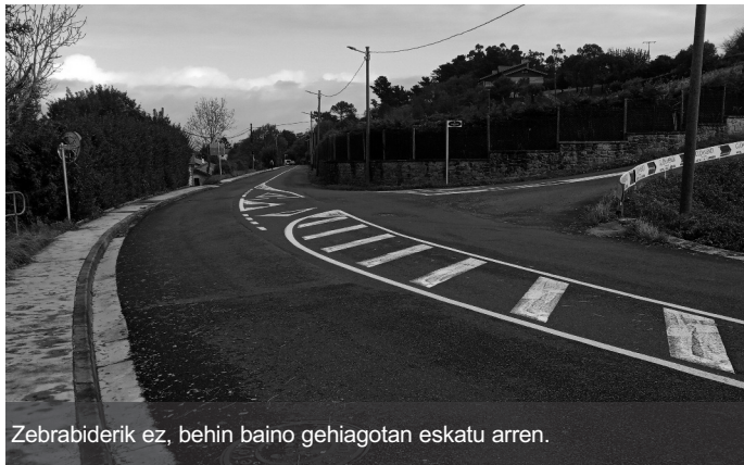
Zerbrabiderik ez, behin baino gehiagotan eskatu arren.