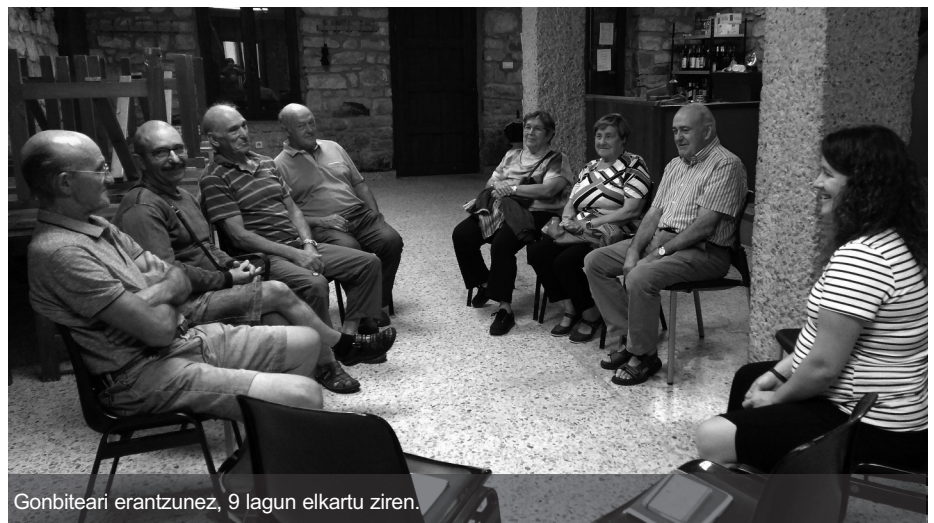
Gonbiteari erantzunez, 9 lagun elkartu ziren.

Iritziak askotarikoak izan ziren, baina hurrengo pauso bezala, urriaren azken ostiralean (urriak 26) pare bat ekintza antolatzea erabaki zuten, Udazken Festaren barruan. Hori horrela, pentsionisten inguruko hitzaldia izango da Duintasuna elkartearen eskutik eta ondoren, afari-merienda. Asmoa da lehenengo bilerari jarraipena