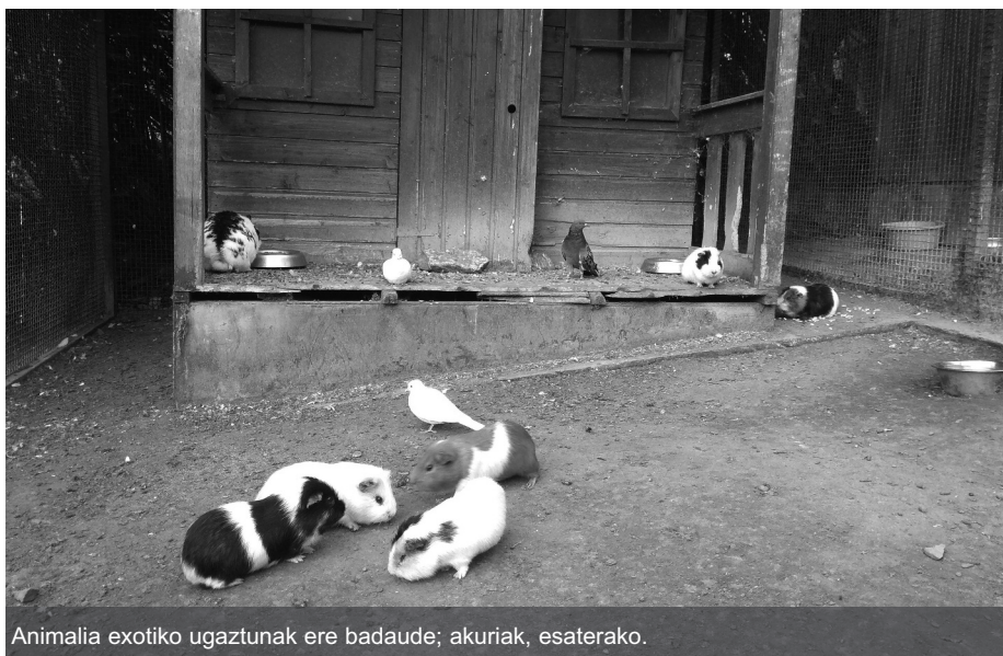
Animalia exotiko ugaztunak ere badaude; akuriak, esaterako.