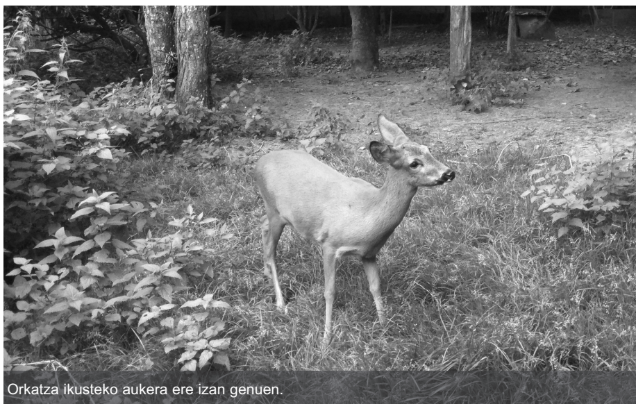
Orkatza ikusteko aukera ere izan genuen.

zapelaitzak, urubiak, hontza txuriak, putreak, belatzak, kaioak, lertxunak, azeriak eta orkatza.