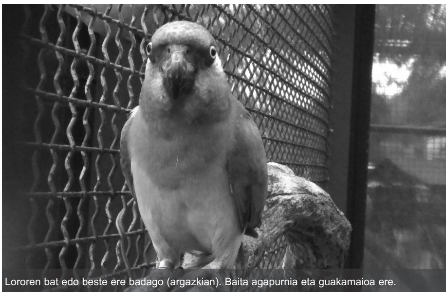
Lororen bat edo beste ere badago (argazkian). Baita agapurnia eta guakamaioa ere.

Hegaztiak nagusi badira ere, ugaztun, anfibio eta narrastiak ere izan ohi dituzte. Momentu honetan, espezie desberdin asko dauzkate. Basoko animaliei dagokienean: