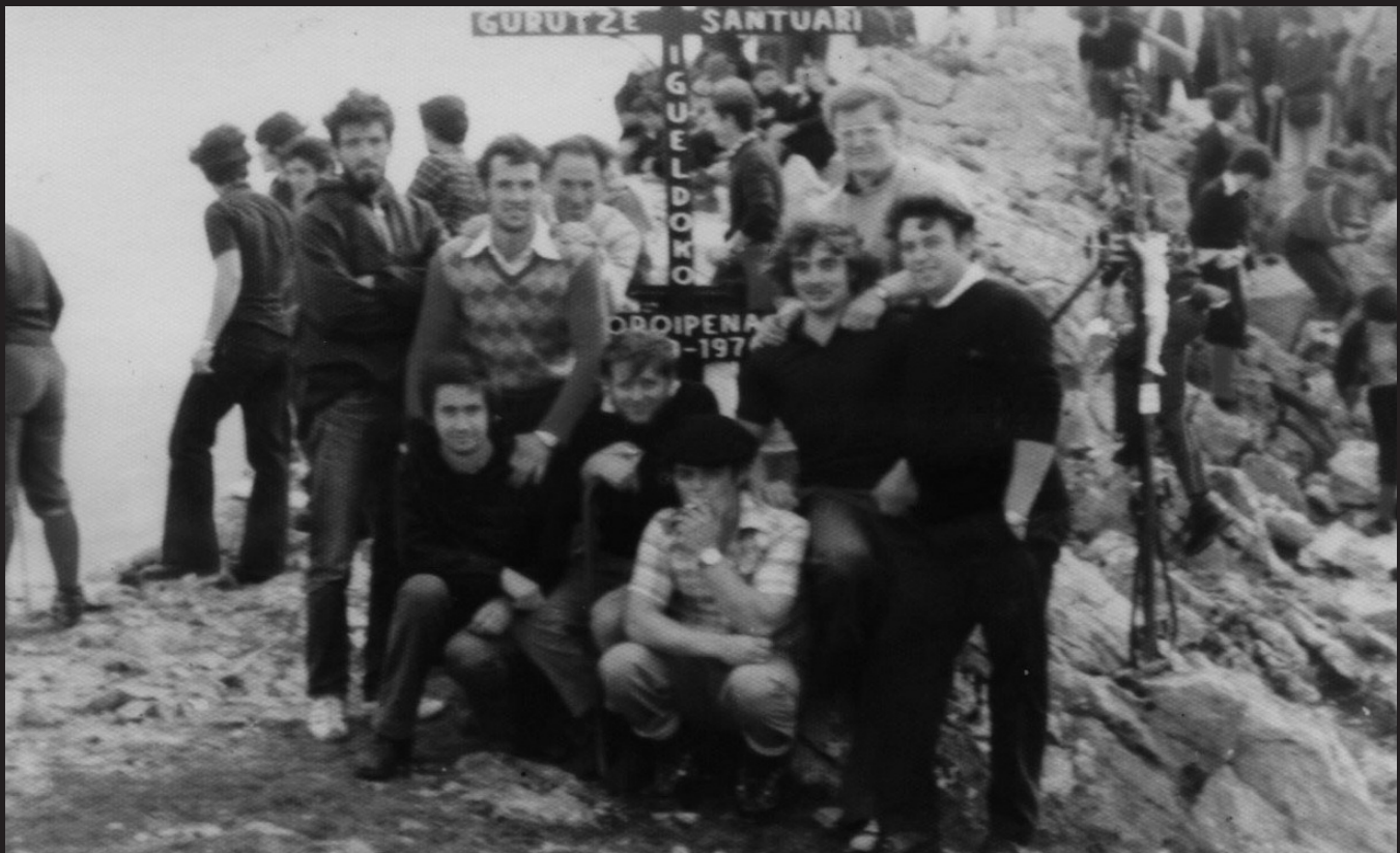
Herriko gazte koadrila batek 1976an eraman zuen gaur egungo gurutzea.