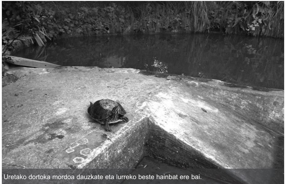
Uretako dortoka mordoa dauzkate eta lurreko beste hainbat ere bai.

Animalia exotikoei dagokienean, argi dute prebentzioa dela gakoa eta hartu beharreko neurriak honakoak direla: «hasteko, ez