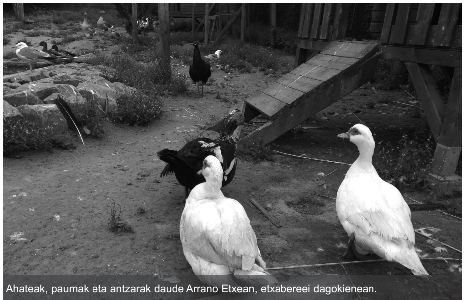
Ahateak, paumak eta antzarak daude Arrano Etxean, etxabereei dagokienean.