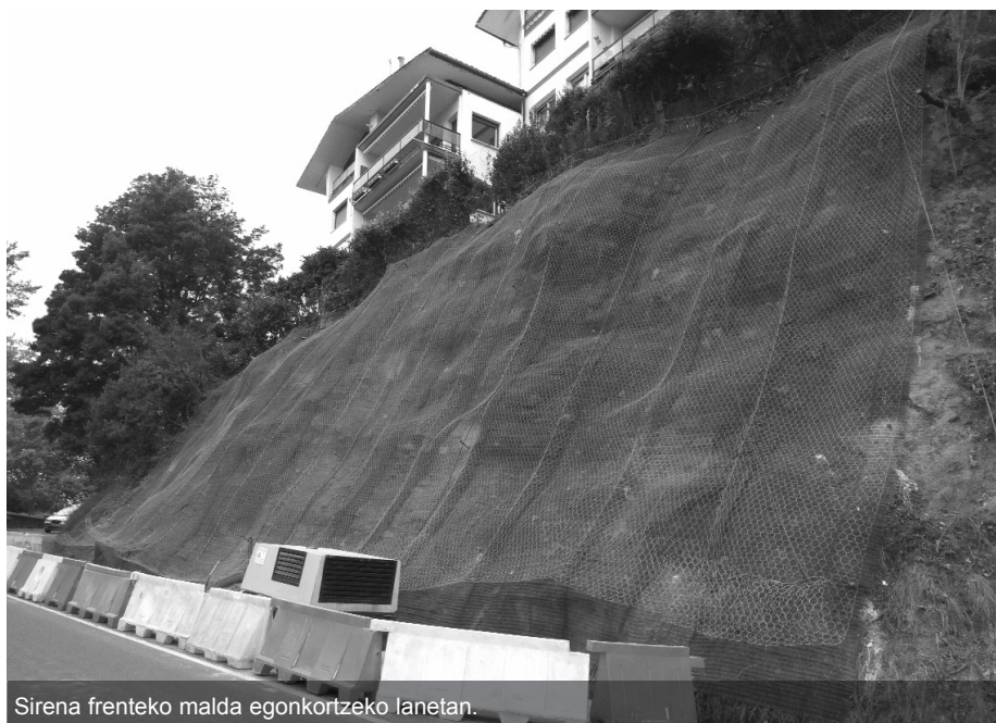
Sirena frenteko malda egonkortzeko lanetan.

Leku Eder inguruan eta Sirena parean, bide bazterretako malkarretan lur-jausiak izan ziren orain dela hilabete batzuk. Leku Ederren garbiketa lanak egin zituzten, zuhaitz-ipurdiak bertan utziz, eta momentuz egonkor dago. Dena dela, zati batzuk zalantzan geratu