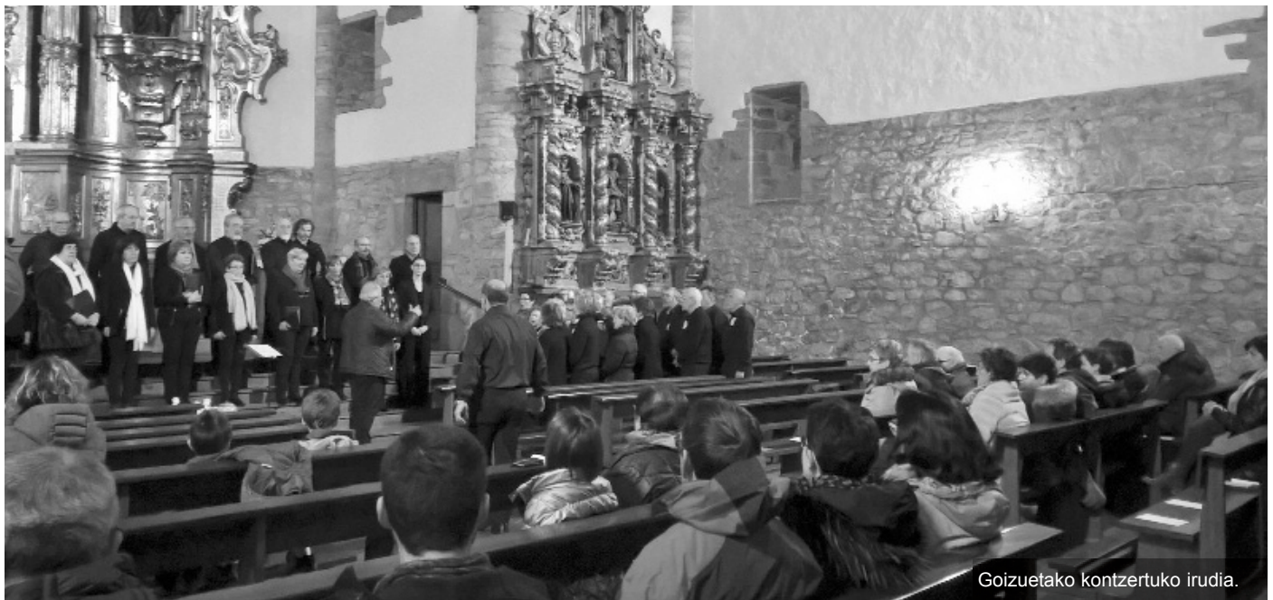
Goizuetako kontzertuko irudia.