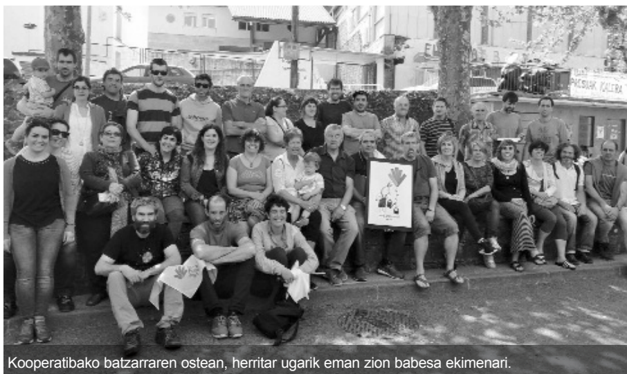
Kooperatibako batzarraren ostean, herritar ugari eman zion babesia ekimenari.