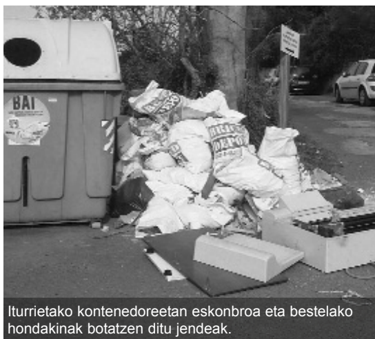
Iturrietako kontenedoreetan eskonbroa eta bestelako hondakinak botatzen ditu jendeak.

Herriko hainbat puntutan, zabor pilaketak sortzen dira, esan bezala, herritar batzuk utzi behar ez den hondakina uzten dutelako bertan. Maiz, Iturrietako kontenedoreetan gertatzen da hori. Zenbait herritarrek eskonbroak eta antzekoak utzi izan dituzte eta hantxe egon izan dira egunetan, udaletxeak berez ez dituelako halako hondakinak jaso-