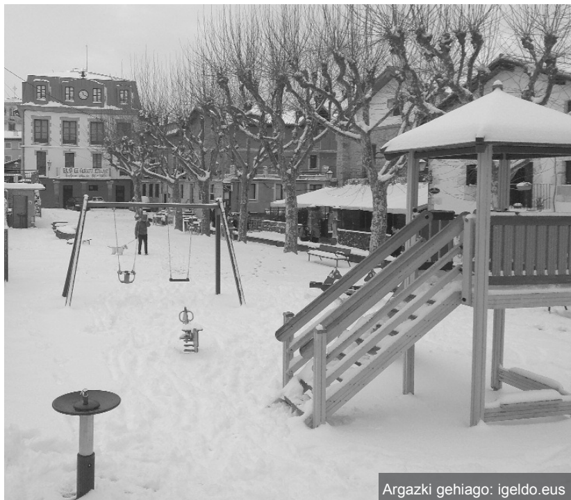
Argazki gehiago: igeldo.eus