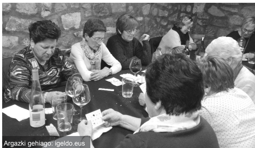
Argazki gehiago: igeldo.eus