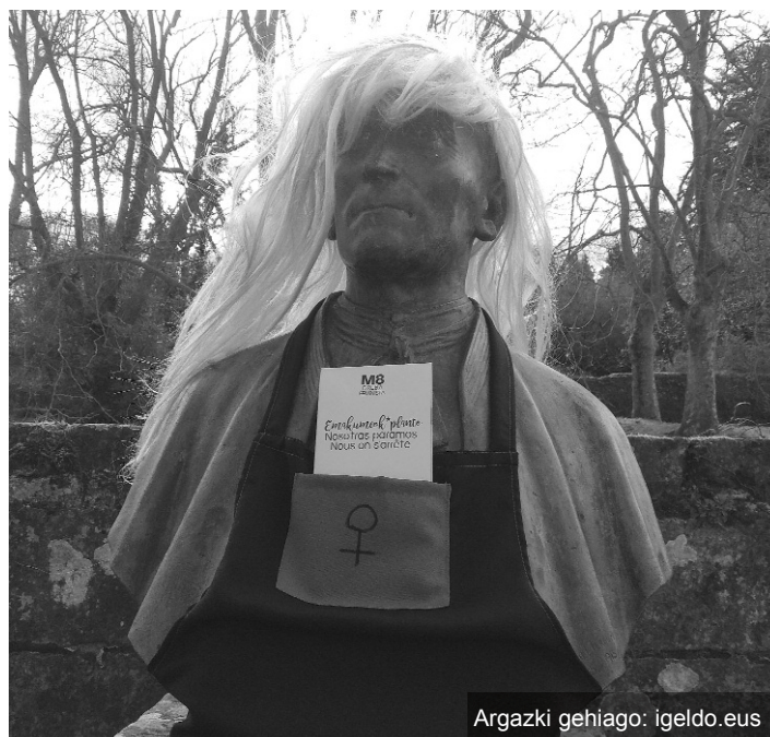
Argazki gehiago: igeldo.eus

Ondoren, 12:30ak aldera, kontzentrazioa egin zuten herri sarreran. 13:00etan, plazara gerturatu ziren berriz eta norberak etxetik eramandako bazkariarekin, tuper-bazkaria egin zuten. Kafe tertuliarako ere izan zuten tarte, 15:00ak bitarte.