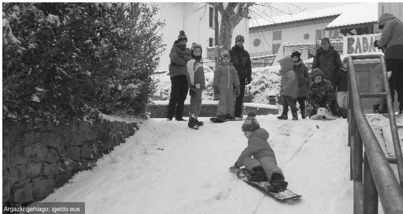
Argazki gehiago: igeldo.eus