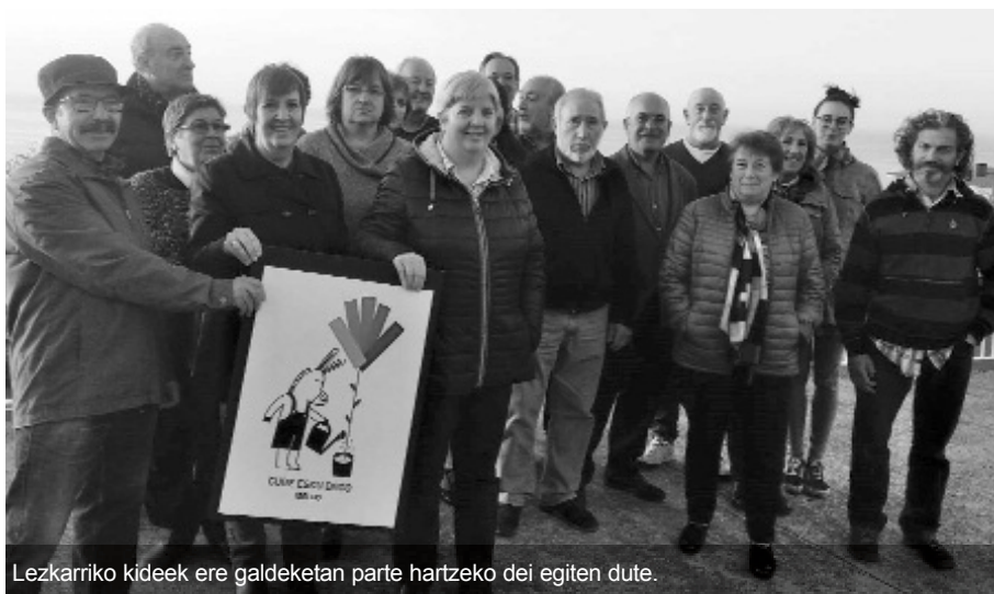
Lezkarriko kideek ere galdeketa parte hartzeko dei egiten dute.