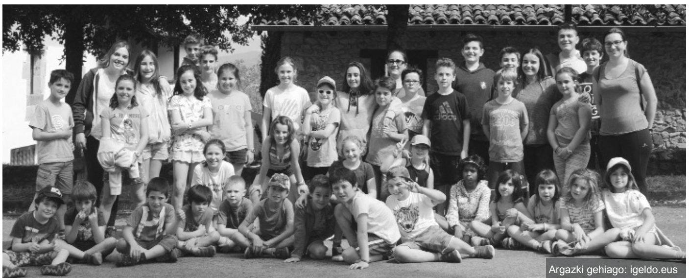
Argazki gehiago: igeldo.eus

Udaberrian sartu ginenetik kontzertu bat baino gehiago eman dituzte Lezkarri abesbatzako kideek eta maiatzaren 12an Igeldon eskainiko dute emanaldia, Udaberri Jaiaren barruan. Azkoitiako Iraurgi abesbatzarekin ariko dira. Aurretik, Goizuetan eta Antiguako Esklabetan aritu dira gerturatutakoen belarriak goxatzen, eta udaberria alaitzen!