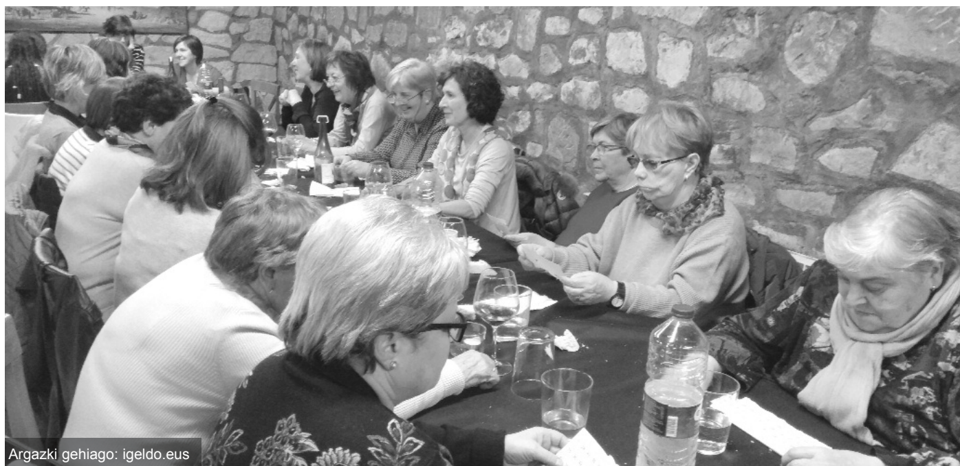
Argazki gehiago: igeldo.eus