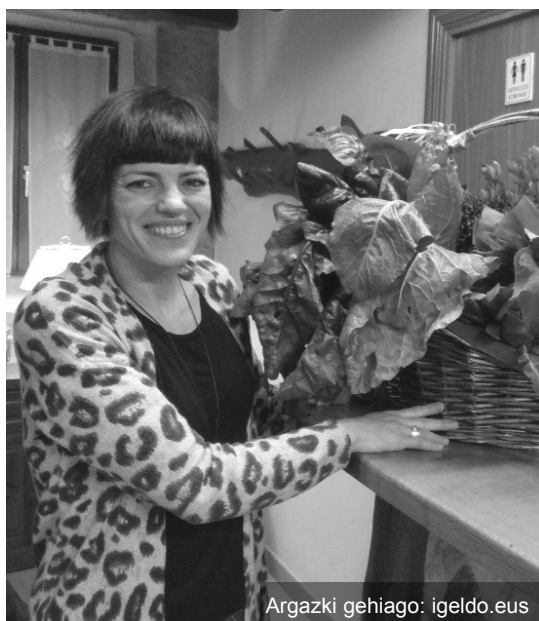
Argazki gehiago: igeldo.eus