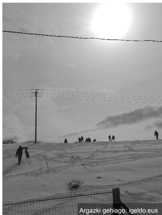
Argazki gehiago: igeldo.eus

Eta ezin ahaztu abenduarekin batera ere elurra iritsi zela Igeldora. Aurtengoa dudarik gabe, elur urtea izan da. Ea zer moduzko udaberri eta uda ditugun!