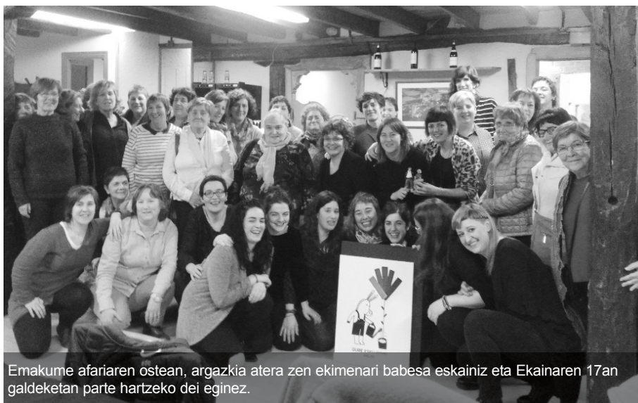
Emakume afariaren ostean, argazkia atera zen ekimenari babesia eskainiz eta Ekainaren 17an galdeketa parte hartzeko dei eginez.

Herritarren ordua da, Igeldon ere erabakitzea goaz!