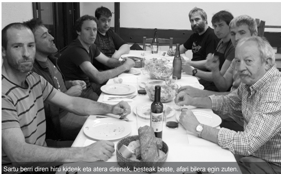
Sartu berri diren hiru kideek eta atera direnek, besteak beste, afari bilera egin zuten.

Bestalde, batzarrean iazko kon-tuak onartuta, aurtengo proposamen eta erabakiak planteatu ziren. Honako hauek izan ziren hartutako erabakiak: Erabiltzaileen Kuota igotzea erabaki zuten (iazko urtean jaitsi egin baitzen), beraz, aurtengo urtean bazkide direnek 1€ ordaindu beharko dute elkarte erabiltzeagatik eta bazkide ez direnek, berria: 2€. Elkarte eskaintzen diren produktuen prezioak urte askoan zehar ez direla berrikusi eta, aur-