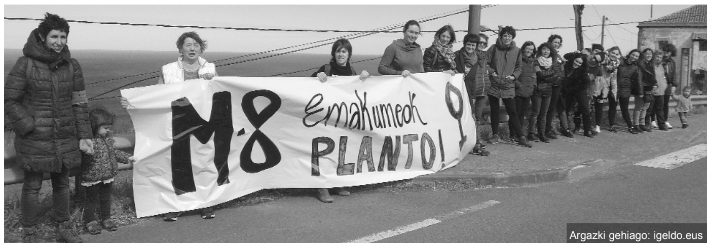
Argazki gehiago: igeldo.eus