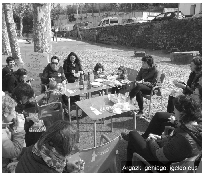
Argazki gehiago: igeldo.eus

Arratsaldean, bigarren deialdi bat egin zen Igeldon. 19:00etan plazan elkartu eta denak batera autobusean jaitsi ziren Donostiako manifestaziora.