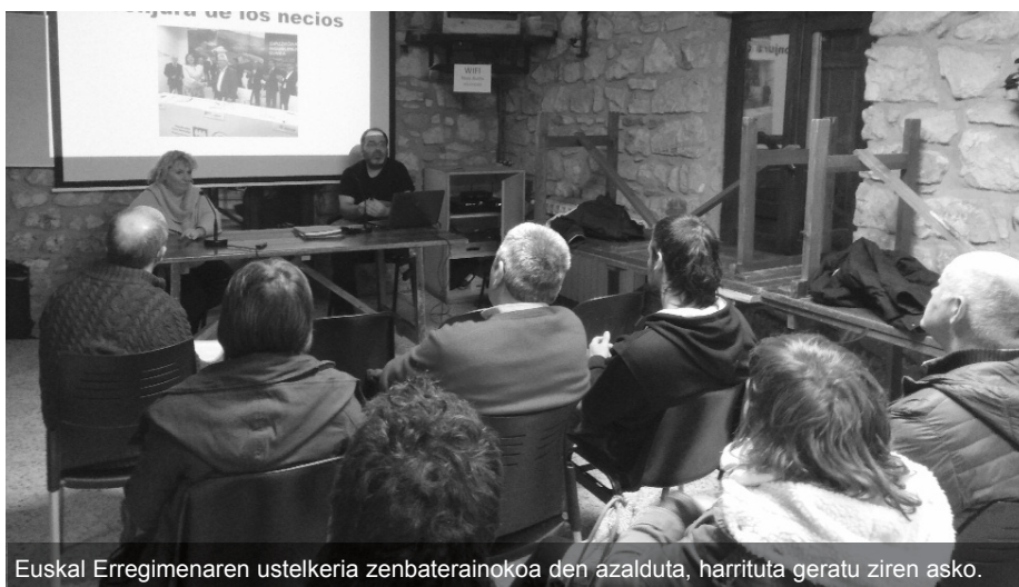
Euskal Erregimenaren ustelkeria zenbaterainokoa den azalduta, harrিতa geratu ziren asko.