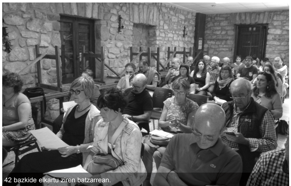
42 bazkide elkartu ziren batzarrean.

Kuota ordaintzeko momentua Bazkide berriek aurreko bazkideekin parekatzeko, 500 euroko kuota ordaindu behar dute eta batzarrean azaldu zuten maiatzaren hasiko direla kobraketekin. Kontu korrante zenbakia pasako dute orain, kolpera 500 euroak ordaintzeko asmoa dutenentzat. Maiatzaren 15erako ordaindu beharko dute horiek. Urte osoan zehar, hilabeteka ordaindu nahi dutenek berriz, beraien kontu korrantea eman