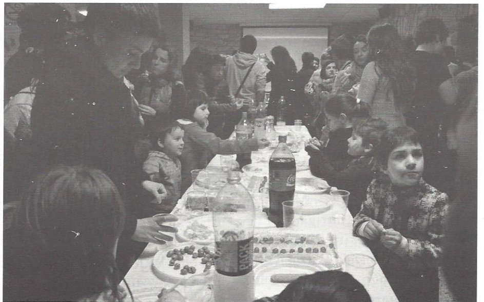
Adin ezberdinetako herritar ugari elkartu zen Itsas Aurren egin zen festan.

Adin txikiko harrera etxeak 4. urteurrena ospatzeko festa antolatu zuten herrian, martxoaren 22an. Orain artean, urteurrenaren inguruan, ate irekiera jardunaldia antolatu izan dute; bide batez, euren etxeak herriarekin irekiz. Baina aurtengoan, herrian, plazan, Itsas Aurre kultur etxean ospatzeko gogoia adierazi zuten, herriarekin konpartitu nahi baitzuten 4. urtemuga hau. Eta igeldotarrei adierazi nahi zieten beraien esker ona, orain artean izandako harremanagatik. Hori horrela, merienda goxoa prestatu zuten inguratu zen guztiarentzat eta ondorenean kontzertutxo bat ere izan zen. Oso giro polita sortu zen eta bai herritarrak bai beraiek, oso positiboki baloratu zuten elkartzeko hori.