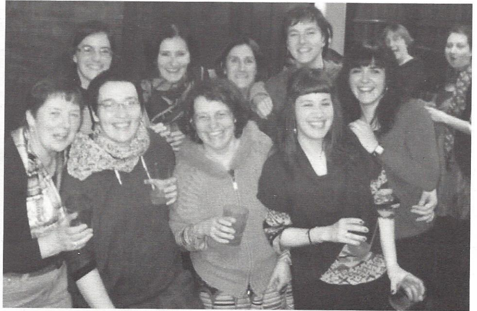
Giro ederrean ibili ziren Calonge sagardotegian.

Horrez gain, Emakumeen Egunaren harira, Pala Txapelketa mixtoa ere egin zen, gazteek antolatuta. Luntxa ere izan zuten ondoren.