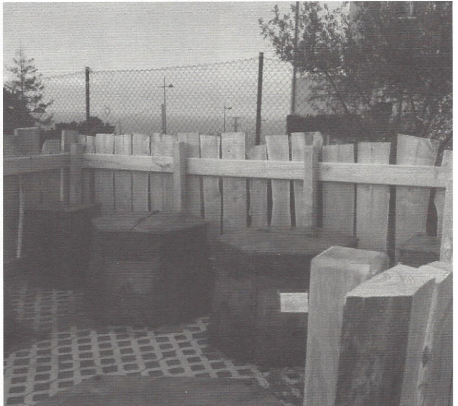
Konposta gunea Babes Ofizialeko Etxeen ondoan dago, herriko sarreran.

Beraz, jada martxan da Igeldoko konposta gunea, ea nolako lana egingen duten bertako partaideek!!!