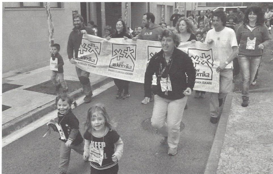
Martxoaren 22an Korrika antolatu zuten Igeldon.

Korrikarekin bat eginez, martxoaren 22an eskolako haur, langile eta gurasoek Korrika antolatu zuten Igeldoko kaskoan. Euren esanetan, “zeharo zirrargarria izan zen hiruhilabeteko azken egunek horrelako amaiera izatea”. Gustora ibili ziren herritar eta ikastolako partaideak Igeldon ere euskararen alde leloa ozen oihukatuz.