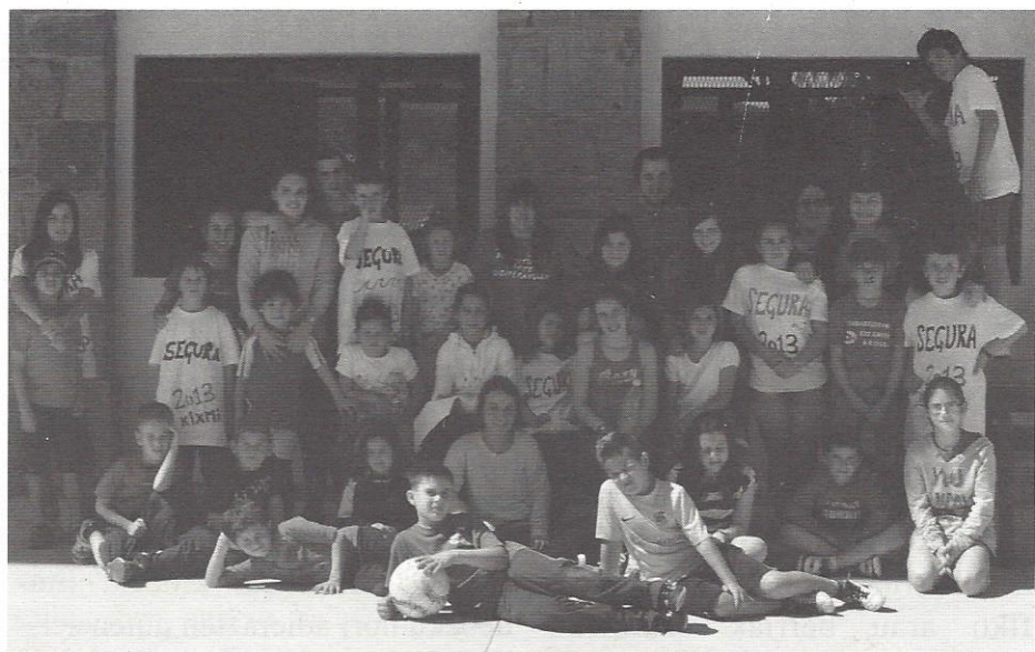
Apirileko bigarren asteburuan egin zuten irteera Segurara. Giro ederrean ibili ziren.

Udaberri festa eta jaiak prestatzen Kixmiri orain, Udaberri festa, herriko