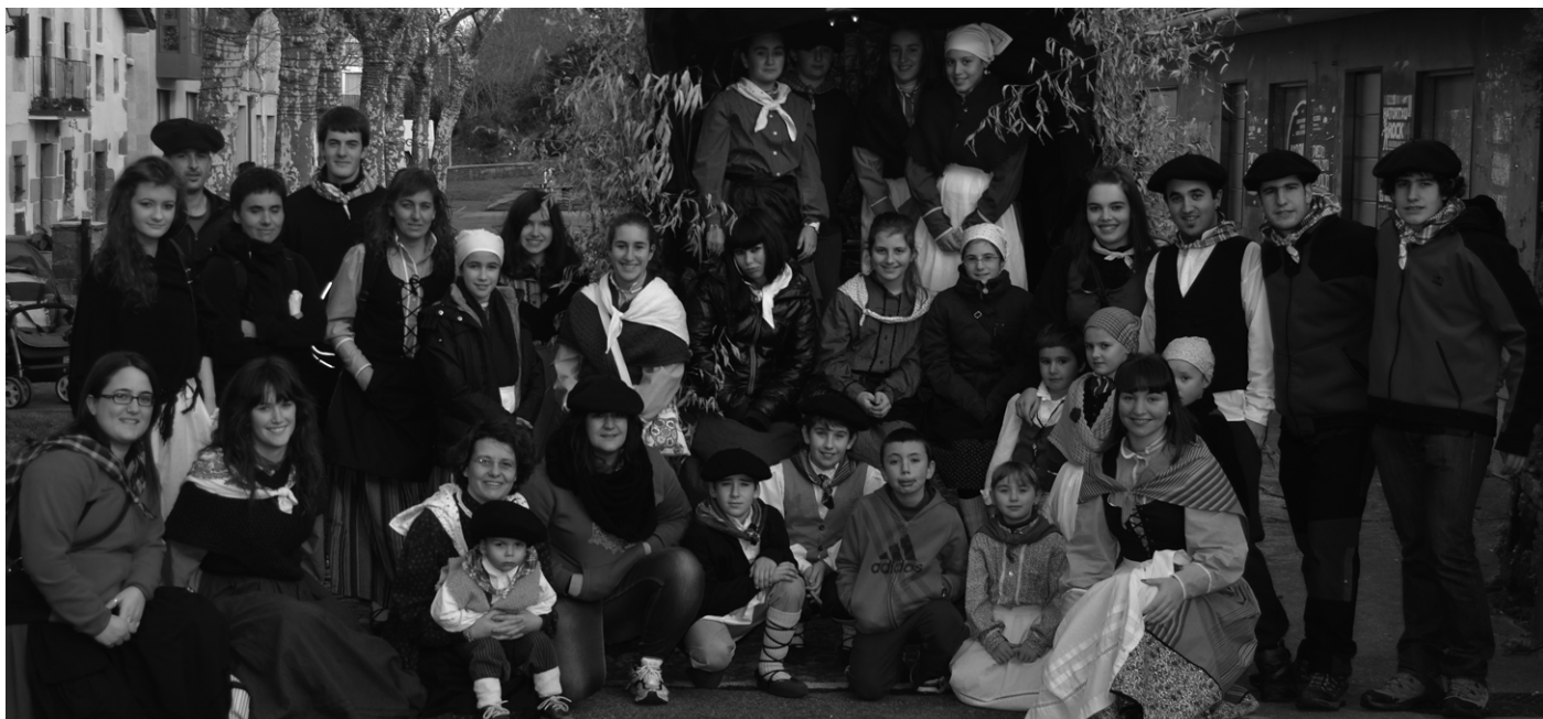
Kuadrila ederra atera da aurten ere eskean.