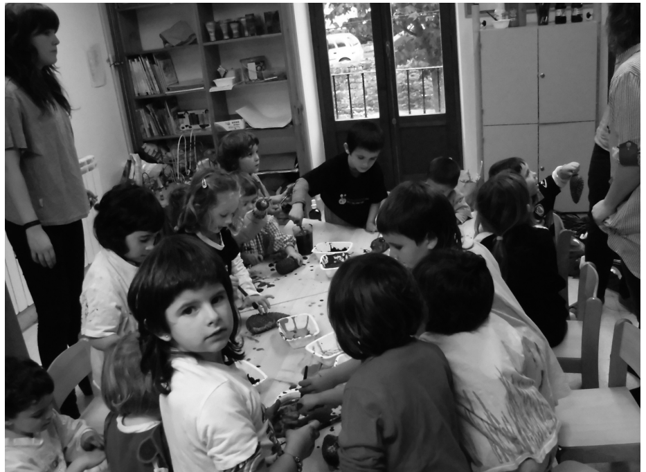
Udazken Festan, txokolatada eta tailerrak egin zituzten.

Gabonetan, eskerako ahotsa fintzeko entsaioak egin ziren abenduaren 15 eta 22an. Azken entsaioan, gainera, tailerra egin zuten. Ludotekako haurrek Olen-