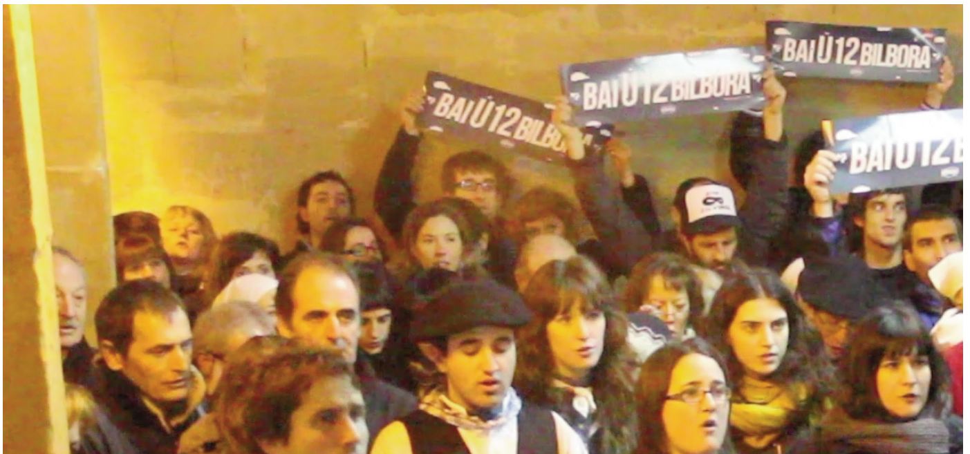
Herritar ugari egin zuen bat Urtezaharreen Herrirak egindako deiarekin eta gogoan izan zituzten preso eta iheslariak.

Gazte Zukguaren prozesua martxoan bukatuko da, gazte antolakunde berriaren jaiotzarekin. Igeldon erabaki da, ekimen puntaletan bakarrik hartuko dela parte, herrian gazte taldea bai baitago. Hori bai, martxoaren 29, 30, 31 eta apirilaren 1ean Gazte Danbada jaialdia egingo da antolakunde berriaren jaiotza ospatzeko eta jaialdiko lanketan parte hartuko dute gazteek.