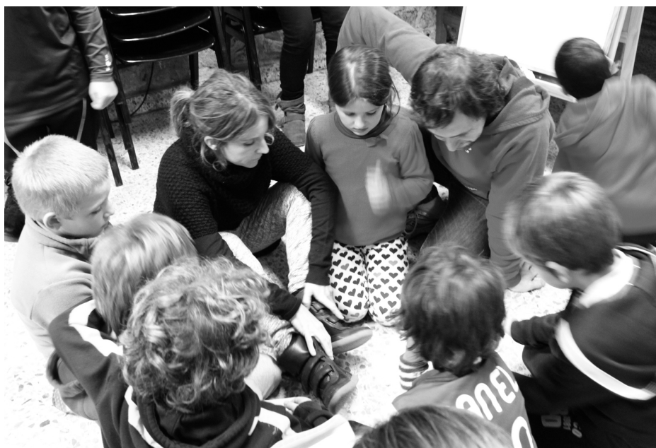
Euskararen Egunean, Kixmik antolatutako ekintzetan parte hartu zuten haur eta gurasoek.