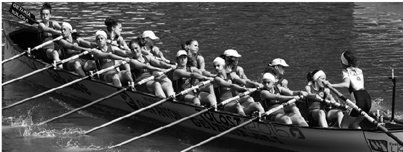
Getaria-Tolosa denboraldi bikaina egiten ari da eta Liga eta Kontxa irabazteko aukera handiak ditu.

1.- Kanpotik gogorra dela ikusten da, dietak, denbora libre gutxi, fetxak... baina azkenean da, bakoitzak nola hartzen duen. Eragina du ere nola hasten zaren arraunean. Gu Igeldoko koadrilatxo bat hasi ginen eta horrek lagundu egiten du. Dena bezala, momentu onak eta txarrak daude.