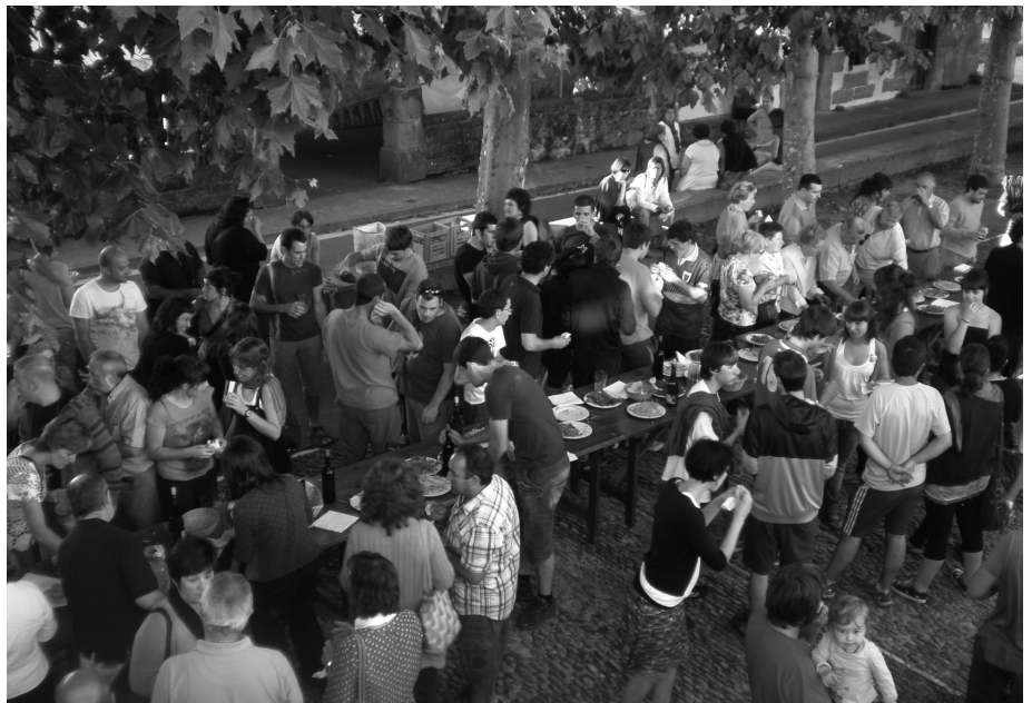
Botoak kontatu bitartean, luntx ederraz gozatzeko aukera izan zuten herritarrek.

Bitartean, kanpoan, herritarren artean jakinmina zen nagusi eta plazan prestaturiko luntxari esker, gosea behintzat asetzeko aukera izan zen. Esan bezala, gaueko 21:30etan aurkeztu ziren emaitzak eta herritarren txaloen artean onepena jaso zuten aukeratutako 7