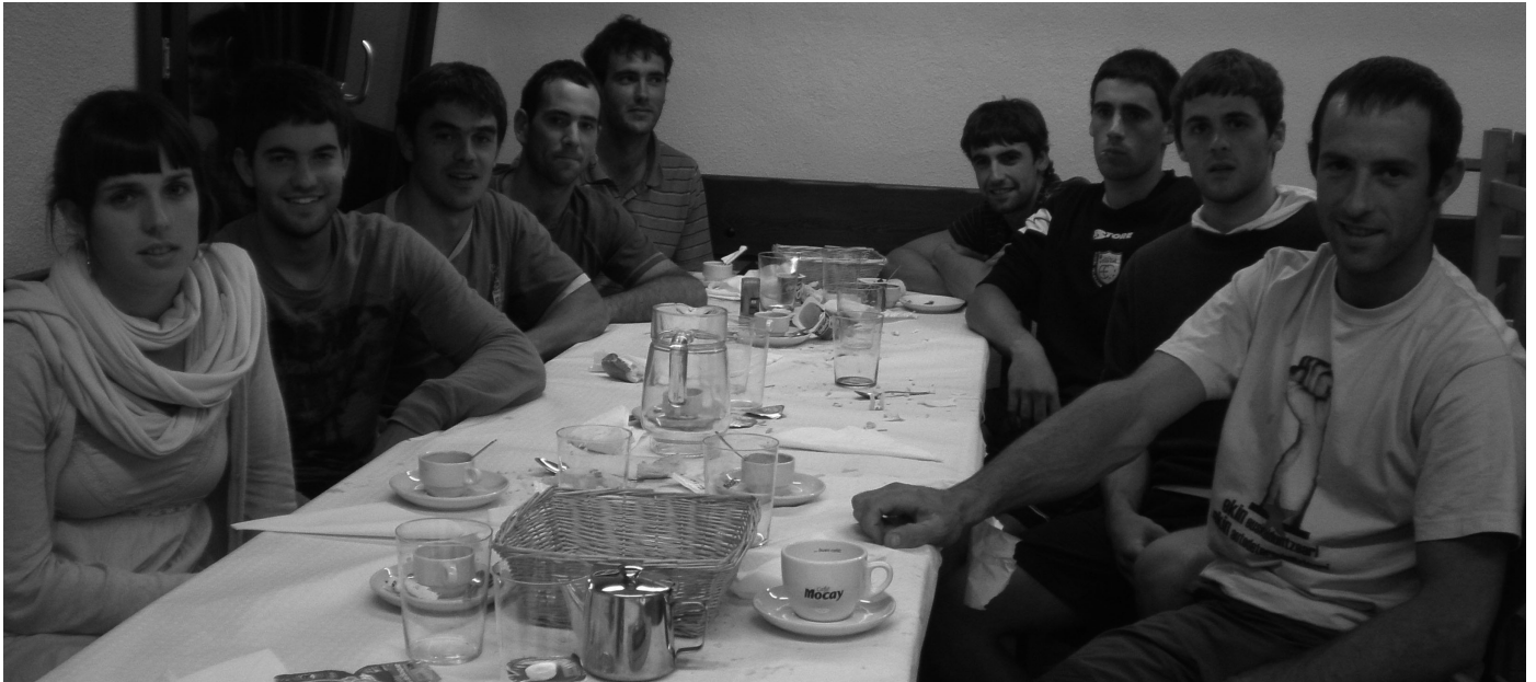
Orri Informatiboko kideek prestatutako afari ederraren bueltan elkartu ziren Igeldoko 9 arraunlariak.

Estropada garaian sartuta gaude eta Igeldon 9 arraunlari ditugunez, Orri Informatiboa beraiekin bildu da denboraldia nola ikusten duten jakiteko, bakoitzaren maila eta taldeari begi-