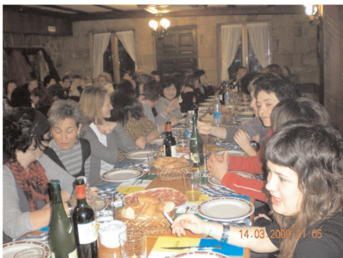
Gustora jan, edan eta hitz egiteko aukera izan zen

Maiatzarekin eta udaberriko festarekin batera, zuen etxeetan gara berriz ere. Dena dela, aurreko alean aurreratu genizuen bezala, Emakume Langilearen eguna ospatzeko, herriko emakumeek afaria egiteko asmoa zuten Etxe Nagusin. Bada espero bezala, afari hori egin zen. Urtero bezala, arrakasta handia izan zuen. Herriko 60bat emakume bildu ziren eta ezer baino lehen, bertako giroaren berri emango dizuegu.