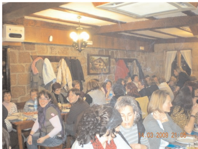
Ameztiko ahizpak begiratu txoritxoari... klik!