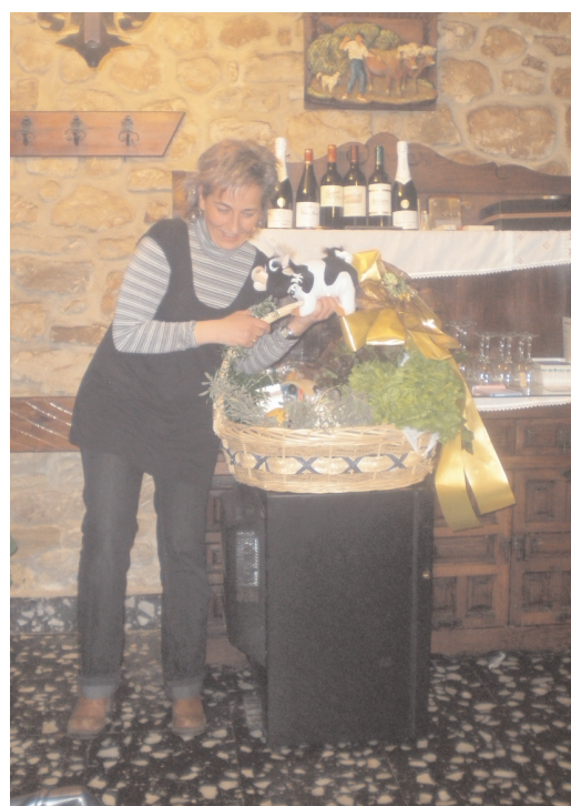
Hilabete osoako badun jana Ixiar, aze karga!!!