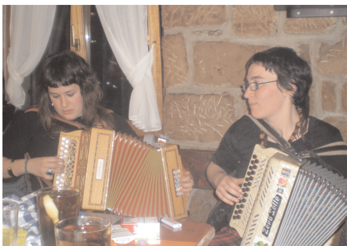
Aspaldiko partez trikitixari hautsa kentzen bikote?