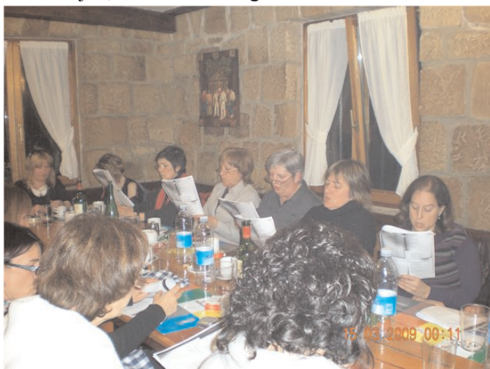
Urteroko legez, tripa ondo bete ondoren kantari!