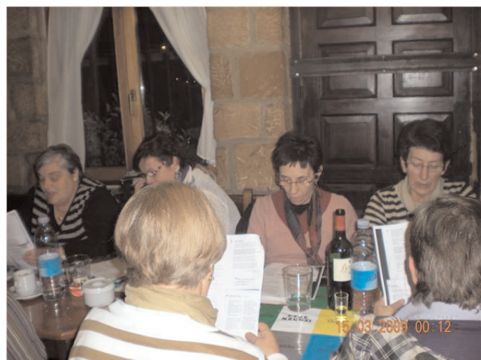
Aiii! adinean gora, bista behera! nun ditun betaurrekuk????